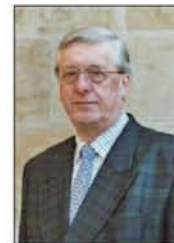
Hans Gelien Bauangelegenheiten und Sport Finkenwerder